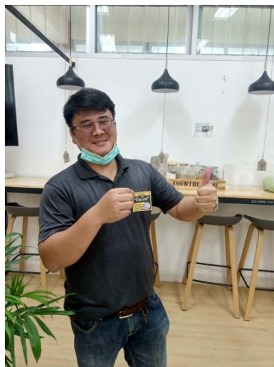
ภาพที่ 5 ผู้บริหารแจกสติ๊กเกอร์ประหยัดพลังงาน