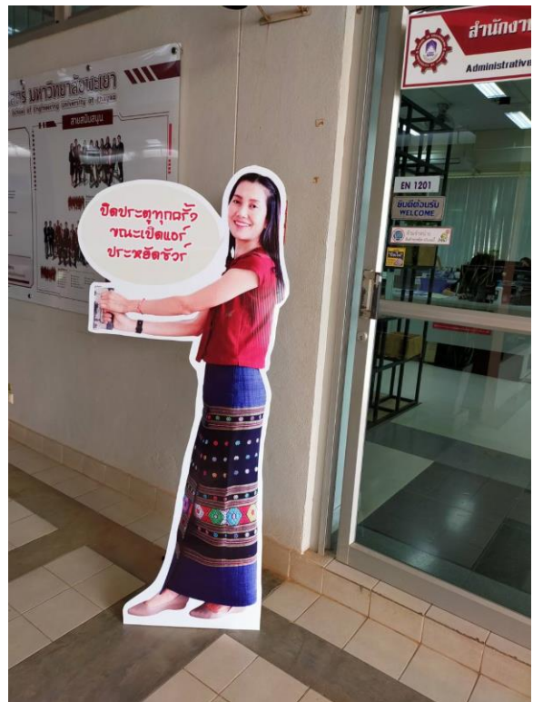
ภาพที่ 2 Stand รูปผู้บริหาร