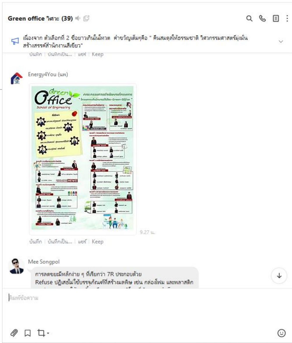
ภาพที่ 7 การประชาสัมพันธ์ผ่าน Application Line (ฉบับปรับปรุง)